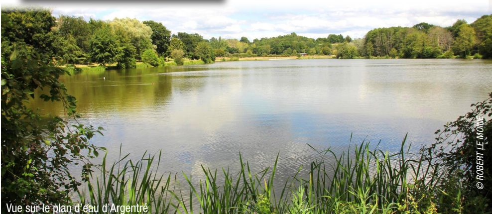
Vue sur le plan d'eau d'Argentré